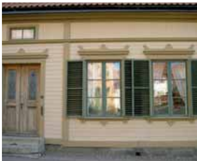
Göthlinska gården.